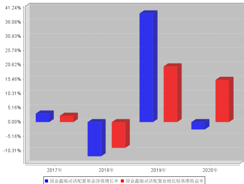
国金鑫瑞灵活配置自基金合同生效以来基金每年净值增长率及其与同期业绩比较基准收益率的对比图

注：本基金合同生效日为 2017 年 9 月 13 日，合同生效当年期间的相关数据和指标按实际存续期