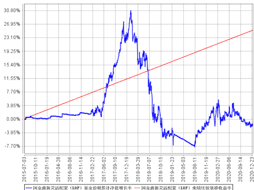
国金鑫新灵活配置（LOF）基金份额累计净值增长率与同期业绩比较基准收益率的历史走势对比图

注：图示日期为 2015 年 7 月 3 日至 2020 年 12 月 31 日。