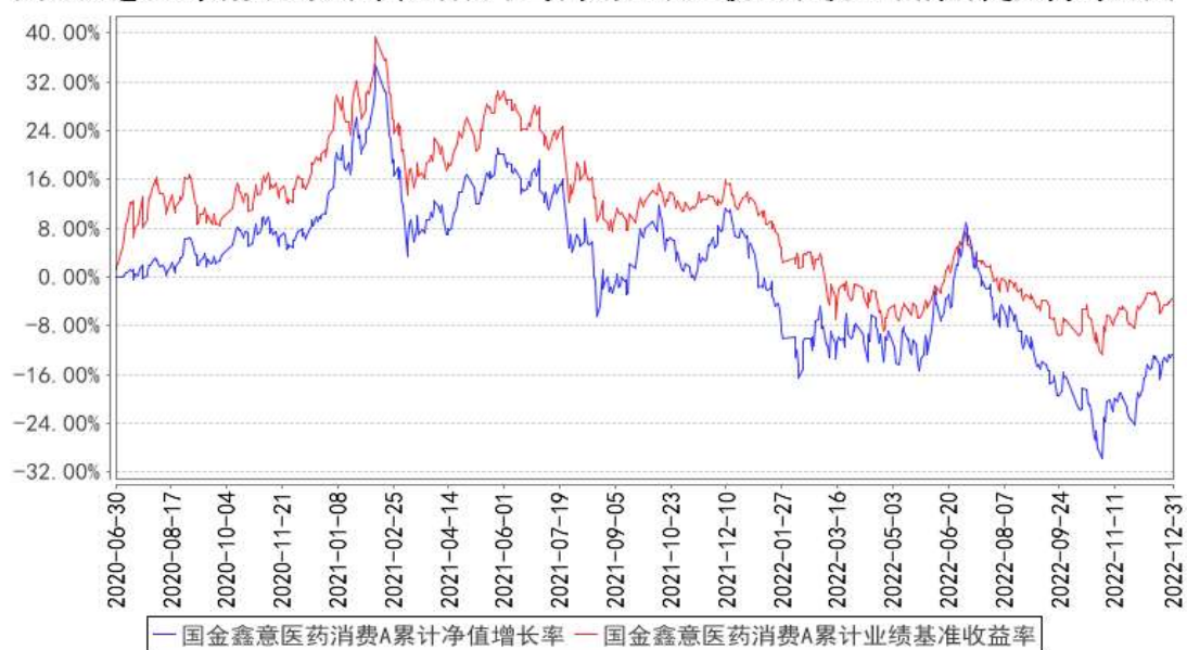
国金鑫意医药消费A累计净值增长率与同期业绩比较基准收益率的历史走势对比图

(二)自基金合同生效以来基金累计净值收益率变动及其与同期业绩比较基准收益率变动的比较