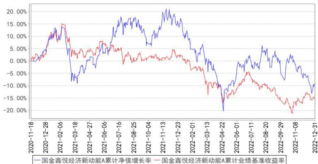
国金鑫悦经济新动能A累计净值增长率与同期业绩比较基准收益率的历史走势对比图

（二）自基金合同生效以来基金累计净值收益率变动及其与同期业绩比较基准收益率变动的比较