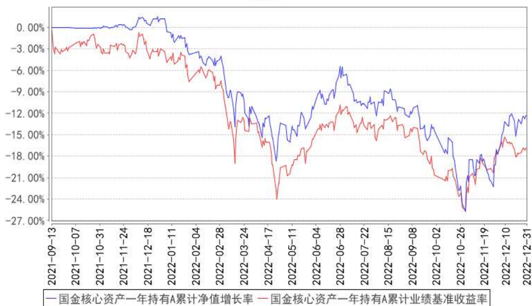
国金核心资产一年持有A累计净值增长率与同期业绩比较基准收益率的历史走势对比图

(二)自基金合同生效以来基金累计净值收益率变动及其与同期业绩比较基准收益率变动的比较