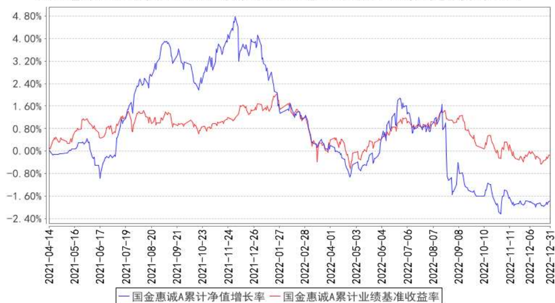
国金惠诚A累计净值增长率与同期业绩比较基准收益率的历史走势对比图